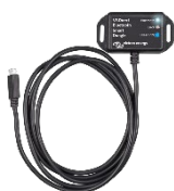
Mochila VE.Direct Bluetooth Smart