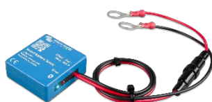
Sensor Bluetooth: Smart Battery Sense