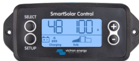
Pantalla enchufable SmartSolar