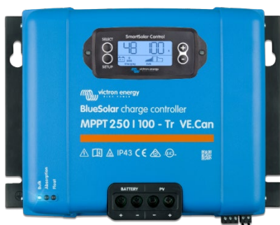
Controlador de carga BlueSolar MPPT 250/100-Tr-VE.Can con pantalla opcional