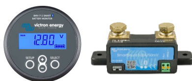
Sensor Bluetooth: Monitor de baterías BMV-712 Smart o SmartShunt