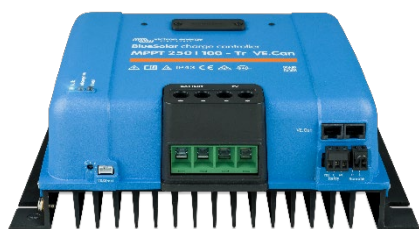
Controlador de carga BlueSolar MPPT 250/100-Tr-VE.Can sin pantalla